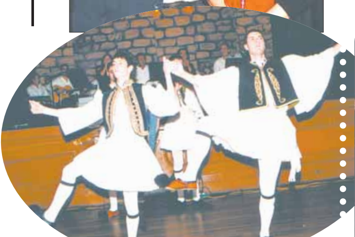
Στιγμιότυπα από την συναυλία “Παράθυρο στην Παράδοση”