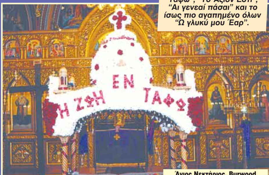
Άγιος Νεκτάριος, Burwood