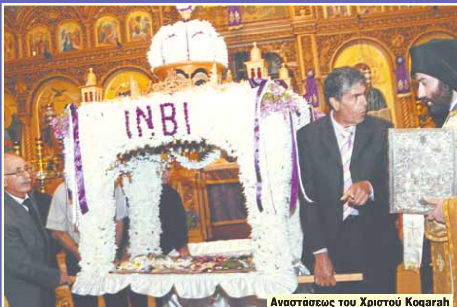
Αναστάσεως του Χριστού Kogarah

Το ιερό έργο του στολίσματος του Επιταφίου αναλαμβάνουν οι κυρίες της Φιλοπώχου μαζί με τα νεαρά κορίτσια που διαλέγουν και ετοιμάζουν τα λογιές λογιές άνθη που θα στολίσουν τον Τάφο του Κυρίου. Το στιγμιότυπο από τον Ιερό Ναό των Αγίων Κωνσταντίνου και Ελένης, Νιούταουν