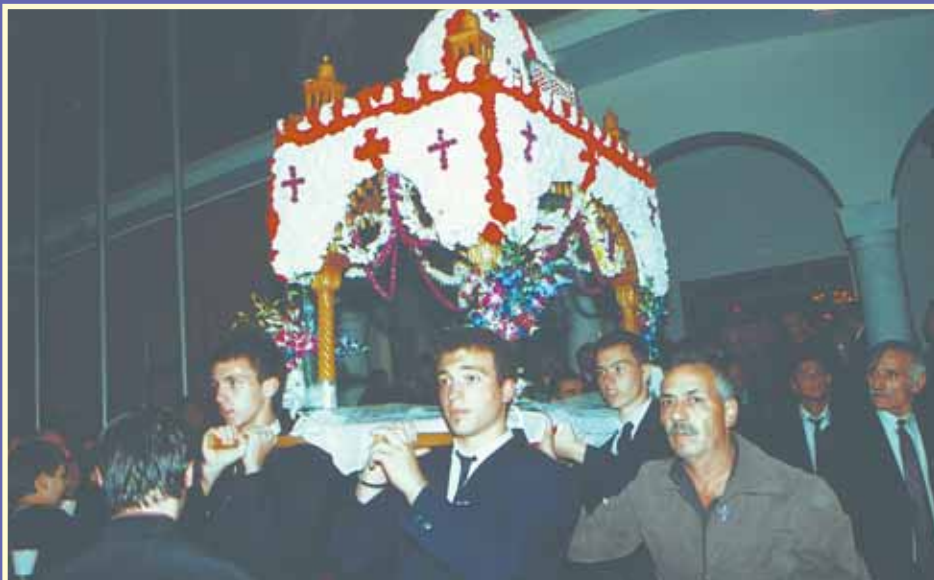
Τα παιδιά του Κολλεγίου της Αγίας Ευφημίας σηκώνουν τον Επιτάφιο.