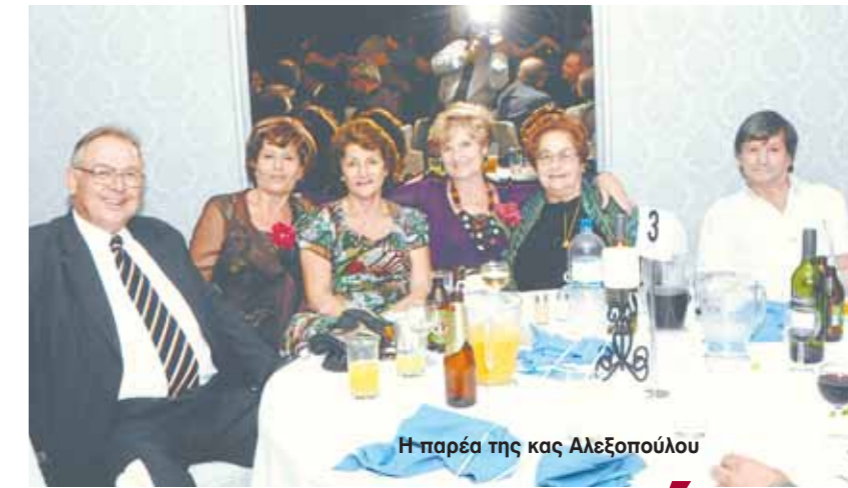
Η παρέα της κας Αλεξοπούλου