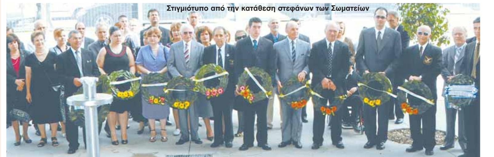
Στημιότυπο από την κατάθεση στεφάνων των Σωματείων