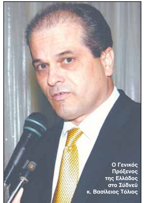
Ο Γενικός Πρόεδρος της Ελλάδος στο Σύδνεϋ κ. Βασίλειος Τόλιος