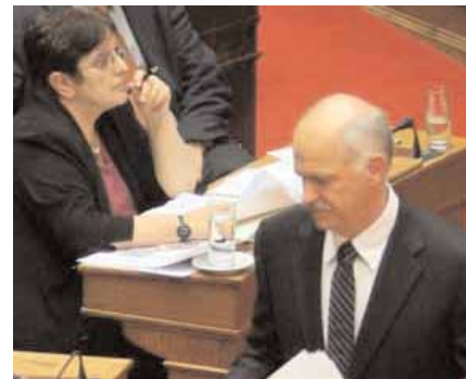
Ο πρόεδρος του ΠΑΣΟΚ στη Βουλή περνά μπροστά από τα έδρανα του ΚΚΕ

Σχολιάζοντας την επιστολή, η κα Παπαρήγα είπε: «Νομίζω ότι δεν χρειάζοταν τόσος καιρός για να αναλάβει την ευθύνη του ο κ. Παπανδρέου και να παραδεχτεί ότι ο αντικομμουνισμός είναι μια επιλογή προεκλογική του ΠΑΣΟΚ».