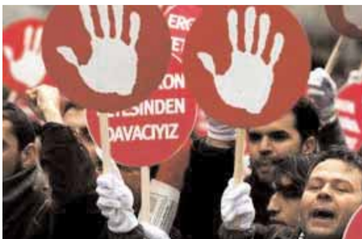
Διαμαρτυρία για το δίκτυο Εργκένεκον

Αγκυρα. - Τουρκικό δικαστήριο αποφάσισε ότι θα παραπεμφθούν σε δίκη άλλοι 56 κατηγορούμενοι για συνωμοσία με στόχο την ανατροπή της τουρκικής κυβέρνησης, ανάμεσά τους και δύο απόστρατοι στρατηγούς, για τους οποίους ο εισαγγελέας έχει ζητήσει την ποινή της ισόβιας κάθειρξης.