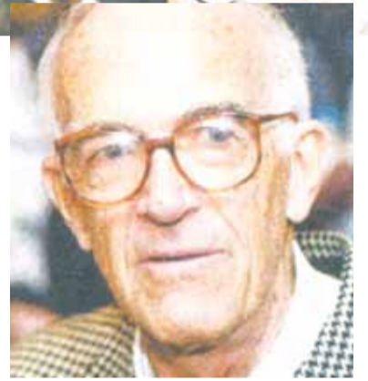
ΣΤΙΣ ΦΩΤΟΓΡΑΦΙΕΣ, συγκινημένα τα παιδιά του Ούτζον, Γιαν και Λιν, δέχονται το θερμό χειροκρότημα για τον πατέρα τους. ΕΝΘΕΤΗ: Ο Τζον Ούτζον

Δεν είδε ποτέ τελειωμένο το κτήριο που σχεδίασε και όταν η Αυστραλία αντελήφθη την αδικία στο πρόσωπό του ήταν πολύ ηλικιωμένος για να ταξιδεύσει.