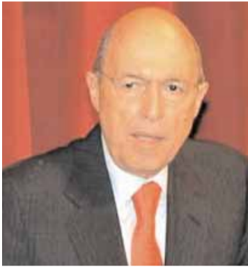
Ο πρώην πρωθυπουργός Κώστας Σημίτης

Η διάλεξη του Κ.Σημίτη στο Πανεπιστήμιο Bilgi αφορούσε τη διαφορετικότητα και τη δημοκρατία στην Ευρωπαϊκή Ένωση. Βασικός άξονας ήταν η ενίσχυση