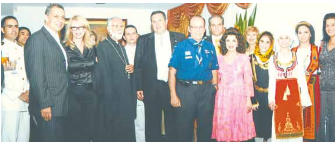
Η κα Ντόρα Τόλιου, η κα Ζερεφού, ο Γενικός Πρόξενος της Ελλάδος στο Σύνδεϊ κ. Βασίλειος Τόλιος, ο κ. Γιώργος Παπαδημητρίου, ο Υφυπουργός Εμπορικής Ναυτιλίας, Αιγαίου και Νησιώτικης Πολιτικής κ. Πάνος Καμμένος, ο πάτερ Ιωάννης Καπέτας, the Hon Virginia Judge MP, ο Υπουργός Υγείας κ. Γιάννης Χατζηστέρνος και ο Ναυτιλιακός Ακόλουθος κ. Δημήτριος Κωσταράκης.