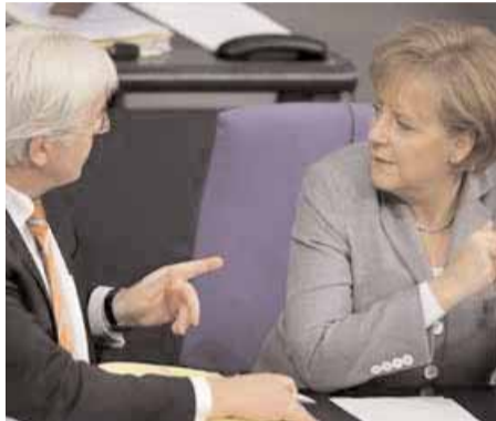
Οι συνεργάτες και αντίπαλοι Φ.Β.Στάινμαγερ και Α.Μέρκελ

Οι τελευταίες δημοσκοπήσεις δείχνουν ότι τα ποσοστά των Χριστιανοδημοκρατών (SDU) της καγκελαρίου Μέρκελ βρίσκονται στο χειρότερο σημείο από το Νοέμβριο του 2006, ενώ οι Σοσιαλδημοκράτες (SPD) βρίσκονται σε κατακόρυφη άνοδο.