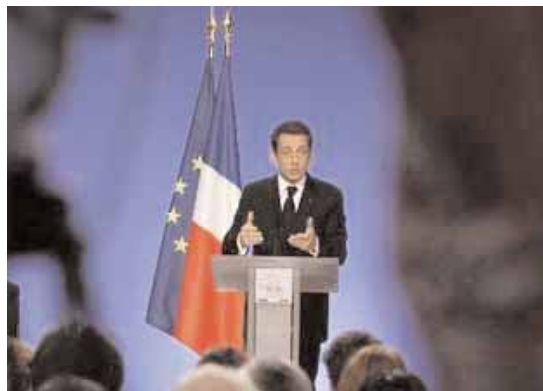
Μπαράζ απειλητικών επιστολών με απειλή δολοφονίας και σφαίρες...

Παρίσι. - Επιστολές που περιέχουν απειλή δολοφονίας και συνοδεύονται από σφαίρες των εννέα χιλιοστών έχουν σταλεί το τελευταίο διάστημα στον Γάλλο πρόεδρο Νικολά Σαρκοζί, τις υπουργούς Εσωτερικών και Δικαιοσύνης και βουλευτές του κυβερνώντος κόμματος.