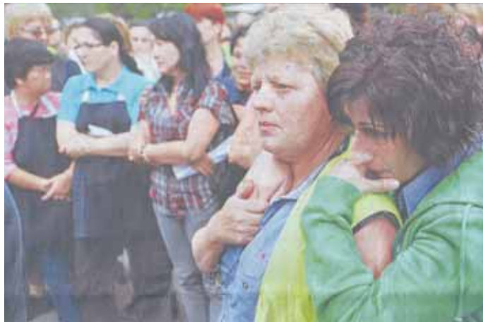
Η δραματική εικόνα της ανεργίας με τους εργαζόμενους που έχασαν τις δουλειές έξω από ένα εργοστάσιο της Pacific Brands.

Η ομοσπονδιακή κυβέρνηση προειδοποίησε το έθνος να είναι έτοιμο για νέες μαζικές απολύσεις εργαζομένων, ύστερα από την απόλυση 2000 ατόμων προχθές καθώς η Αυστραλία υποφέρει τις επιπτώσεις από την κρίση στην παγκόσμια οικονομία.