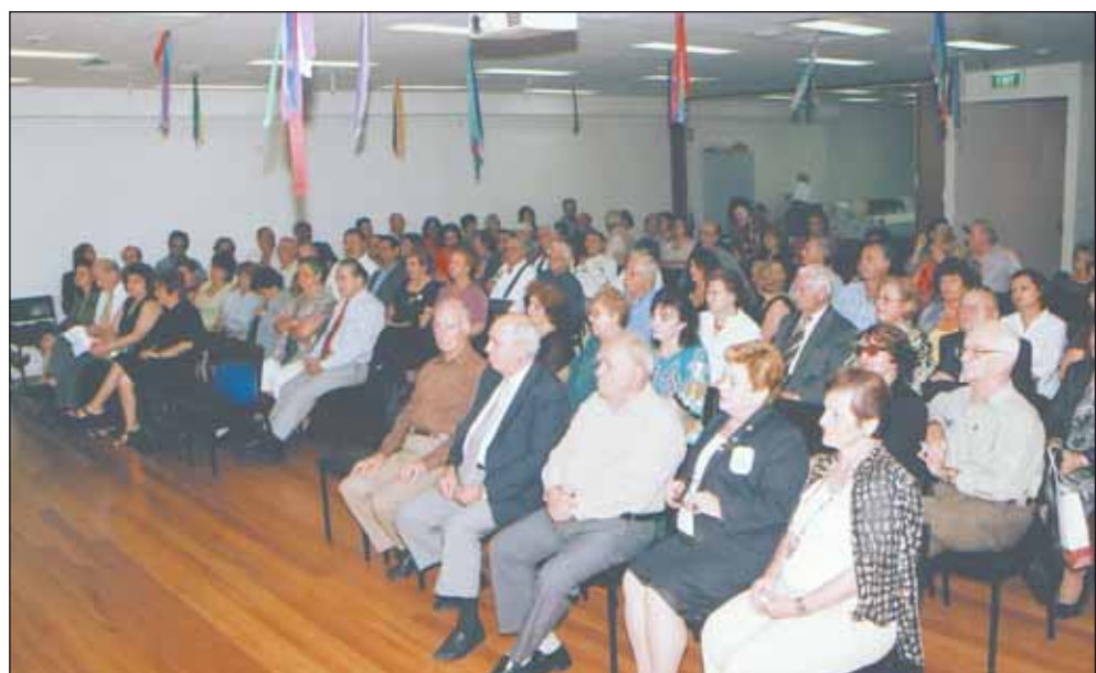
Άποψη του κόσμου που παρακολούθησε την ομιλία.