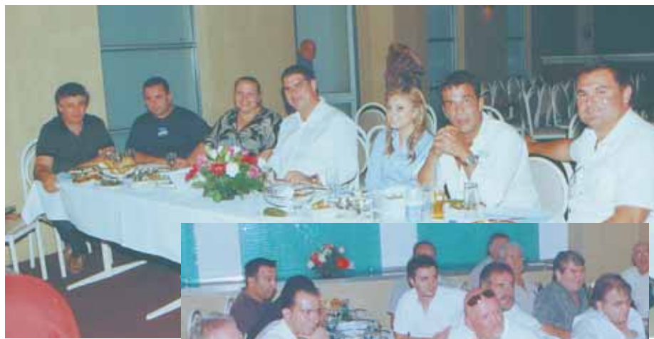
ΠΑΝΩ: Οι άνθρωποι του Σ. Ολύμπικ. ΔΕΞΙΑ: Άποψη των εκπροσώπων του Τύπου που παραβρέθηκαν στη συνάντηση.