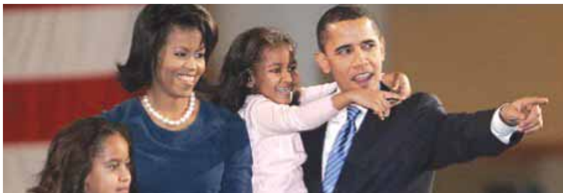
Δύο φανέλες της Σεβίλλης έλαβαν ως δώρο οι κόρες του Μπαράκ Ομπάμα.