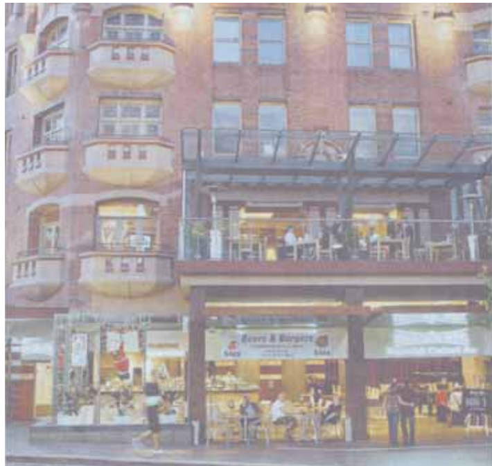
Το ξενοδοχείο Kings Cross επί τής William Street.

«Το πρόβλημα με το Κινγκς Κρος δεν είναι οι επιχει-