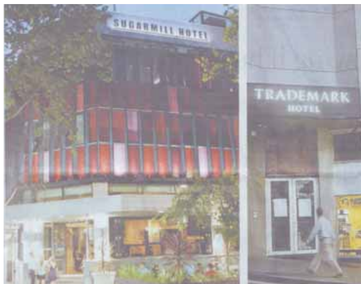
ΑΡΙΣΤΕΡΑ το Sugarmill Hotel επί τής Darlinghurst Road και ΔΕΞΙΑ το Trademark Hotel επί τής Bayswater Road.

ρηματίες, αλλά οι αρχές που δίνουν τις άδειες λειτουργίας στα στριπτίζ κλαμπ. Γιατί δεν ελέγχουν αν τα άτομα αυτά είναι κατάλληλα και αφού τους δώσουν τις άδειες γιατί δεν ελέγχουν αν λειτουργούν νόμιμα; Εγώ προσωπικά ποτέ δεν παρανόμησα και γι' αυτό άλλωστε η Επιτροπή Γουντ δεν βρήκε τίποτε επιλήσιμο εναντίον μας», δηλώνει ο κ. Αρματάς.