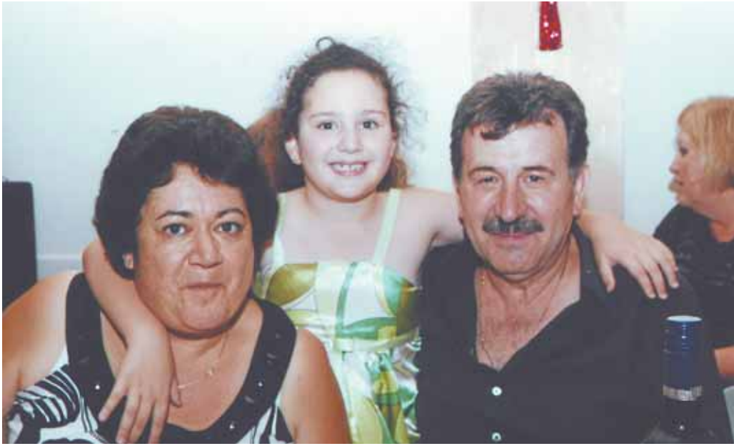
Το ζεύγος Τασούλος μαζί με την κόρη τους στην Κυπριακή Κοινότητα