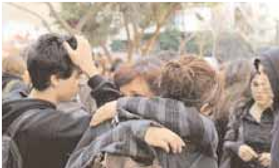
Οδύνη και βουβά «γιατί» στη γωνία Μεσολογγίου και Τζαβέλλα, στα Εξάρχεια. Συνομήλικα παιδιά, μαθητές της Α΄ Λυκείου, στον τόπο που ο Αλέξης Γρηγορόπουλος έχασε τη ζωή του και το όνειρό του