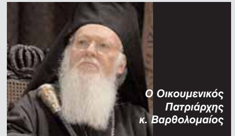
Ο Οικουμενικός Πατριάρχης κ. Βαρθολομαίος

Καταλήγοντας, είπε ότι οι παράνομοι έποικοι, οι εγγυήσεις και η αποχώρηση των κατοχικών δυνάμεων από το νησί αποτελούν ουσιώδη θέματα και η Τουρκία πρέπει να τα αντιμετωπίσει.