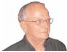
Επιμέλεια ΓΙΩΡΓΟΥ ΚΑΤΖΗΒΑΣΙΛΗ