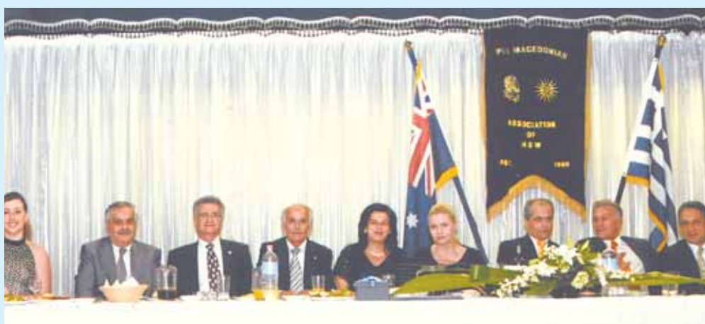
Ο Νομάρχης Θεσσαλονίκης τίμησε με την παρουσία του την ετήσια χοροεσπερίδα της Παμμακεδονικής Ένωσης στο Westside Reception

Τηλ: 9560 8441 105A Illawarra Rd., Marrickville