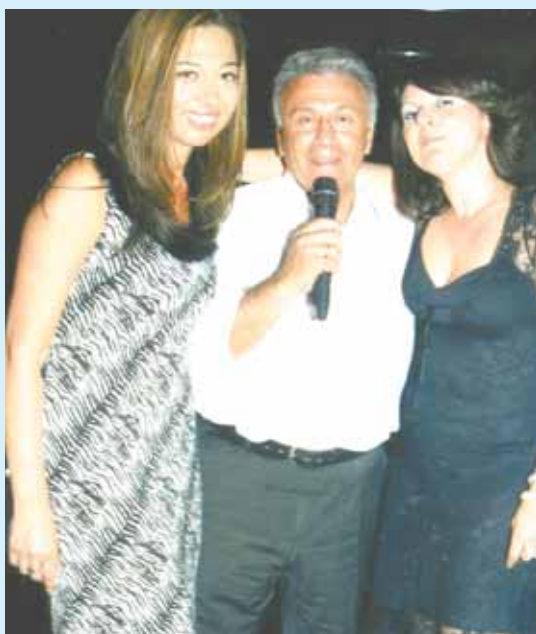
Επί τω έργω στην... πίστα του Νότες Live