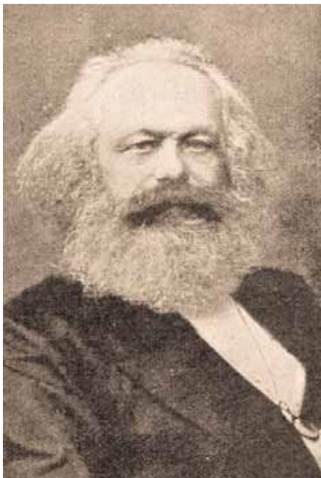
Karl Marx, ο ιδρυτής του επιστημονικού σοσιαλισμού