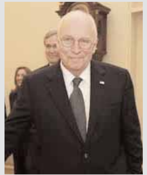
Ο Ντικ Τσένι έχει βεβαρημένο ιατρικό ιστορικό

* Σε μία άλλη εξέλιξη, η Νάνσι Ρίγκαν, 87 ετών, χήρα του πρώην προέδρου των ΗΠΑ Ρόνλαντ Ρίγκαν, εισήχθη σε νοσοκομείο του Λος Άντζελες με σπασμένη λεκάνη μετά από πτώση που είχε πριν από λίγες ημέρες στην κατοικία της. Θα παραμείνει για λίγες ημέρες στο νοσοκομείο και είναι «σε καλή κατάσταση».