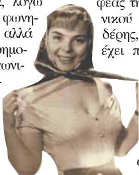
Η Δάφνη Σκούρα σε νεαρή ηλικία

Η Δάφνη Σκούρα, έπειτα από 40 χρόνια θητείας στο θέατρο και στον κινηματογράφο, παραπλοισμένη τελευταία, λόγω προβλήματος με τις φωνητικές της χορδές, αλλά παρούσα πάντα σε δημοκρατικούς και κοινωνικούς αγώνες, κυκλοφόρησε πρόσφατα ένα βιβλίο με τίτλο «Βαθιές είναι οι ρίζες» (εκδόσεις «Προσκήνιο»). Οπου δεν αρκείται στην άκρως ενδιαφέρουσα καλ-