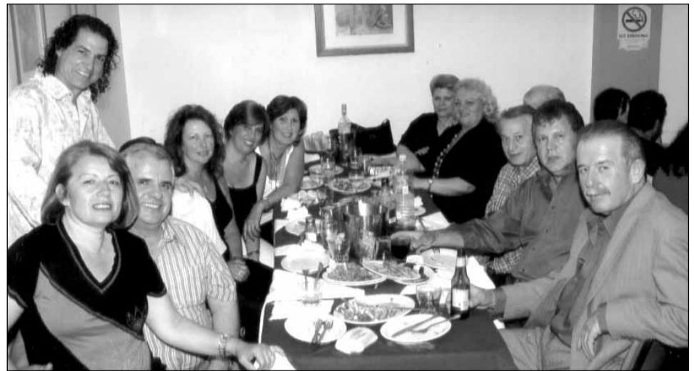
Η μεγάλη παρέα του "Σπάστα" διασκεδάσε μέχρι αργά, στο Κλαμπ της Κυπριακής Κοινότητας. Εδώ με τον τραγουδιστή Γ. Καψή