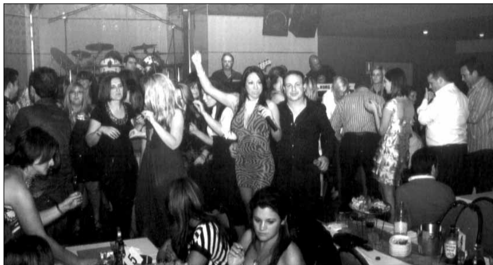
Γεμάτη η πίστα του NOTES Live, από κόσμο που διασκεδάζει μέχρι τις πρωινές ώρες