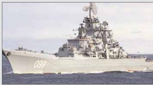
Το πυρηνοκίνητο καταδρομικό «Μέγας Πέτρος» είναι η ναυαρχίδα του στόλου