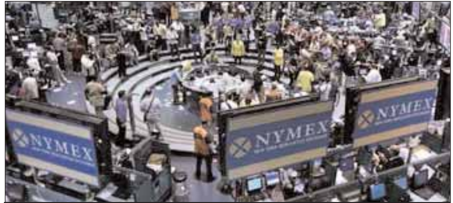
Το Χρηματιστήριο Εμπορευμάτων της Νέας Υόρκης

Τη Δευτέρα, το αμερικανικό αργό πετρέλαιο παράδοσης Οκτωβρίου έφτασε για λίγο σχεδόν στα 130 δολάρια, μία άνοδος της τάξης των 25,45 δολαρίων σε