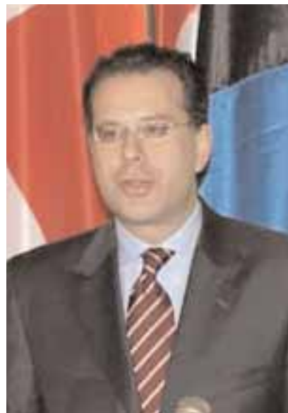
Ο εκπρόσωπος του ΥΠΕΞ, Γ. Κουμουτσάκος

κή επίλυσης του ζητήματος της ονομασίας, αλλά και με το ενδεχόμενο ανάληψης κάποιας πρωτοβουλίας από την αμερικανική αντιπροσωπεία στο περιθώριο των εργασιών της Γενικής Συνέλευσης του ΟΗΕ, ο κ. Κουμουτσάκος δήλωσε ότι «οι προσπάθειες ή η συμβολή υποστήριξης της διαδικασίας των Ηνωμένων Εθνών, η οποία παραμένει η μόνη και κύρια διαδικασία για την εξεύρεση λύσης, είναι καλοδεχούμενες. Αλλά ως τέτοιες. Όχι ως αυτόνομες πρωτοβουλίες πέραν και εκτός πλαισίου ΟΗΕ».