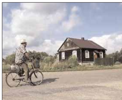
Το σπίτι όπου εκρατείτο η νεαρή γυναίκα

Η υπόθεση έφερε στη μνήμη την περίπτωση του Αυστριακού Γιόζεφ Φρίτςλ, που το περασμένο Απρίλιο αποκαλύφτηκε ότι κρατούσε επί 24 χρόνια την κόρη του στο υπόγειο του σπιτιού του και είχε κάνει μαζί της επτά παιδιά.