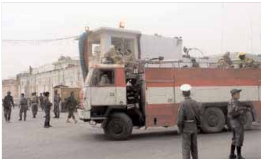
Στη δίνη της βίας συνεχίζουν να ζουν οι Αφγανοί

Αμερικανική στρατιωτική πηγή ανέφερε ότι οι δυνάμεις της σκότωσαν 10 αντάρτες στη νοτιοανατολική επαρχία του Χοστ το Σάββατο. Απώλειες στις τάξεις των στρατιωτών δεν αναφέρθηκαν από την πηγή αυτήν. Από το 2005 και μετά οι Ταλιμπάν, που εκδιώχθηκαν από την εξουσία τέλη 2001, έχουν εντεί-