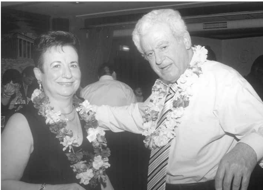
Η κα Βίκυ με τον σύζυγο της στην πίστα του Μεγάλου Αλεξάνδρου