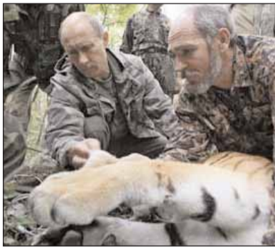
Ο Βλαντιμίρ Πούτιν και, δεξιά, ένας επιστήμονας πάνω από την ναρκωμένη τίγρη

Για το ίδιο ζήτημα το πρακτορείο Interfax σημειώνει ότι «χά-