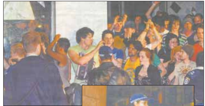
ΑΝΩ, συμπλοκή με αστυνομικούς σε παράνομο πάρτι και ΔΕΞΙΑ, αστυνομικός επί της Market St μετά τα μαχαιρώματα.

Το περασμένο Σαββατοκύριακο, εκατοντάδες αστυνομικοί περιπολούσαν τους δρόμους του Σίδνεϊ, όπου έκαναν 144 συλλήψεις για ληστεία, βίαιες επιθέσεις και 54 για εμπορία ναρκωτικών.