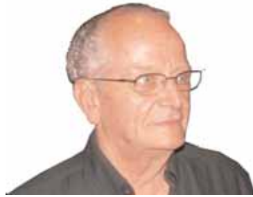
Επιμέλεια ΓΙΩΡΓΟΥ ΧΑΤΖΗΒΑΣΙΛΗ

Την ώρα εκείνη πλησιάζει ο διευθυντής τού κλαμπ και λέει να μη διαμαρτύρονται επειδή οι αργοί γκολφέρ είναι... τυφλοί και δικαιούνται να παίξουν γκολφ!