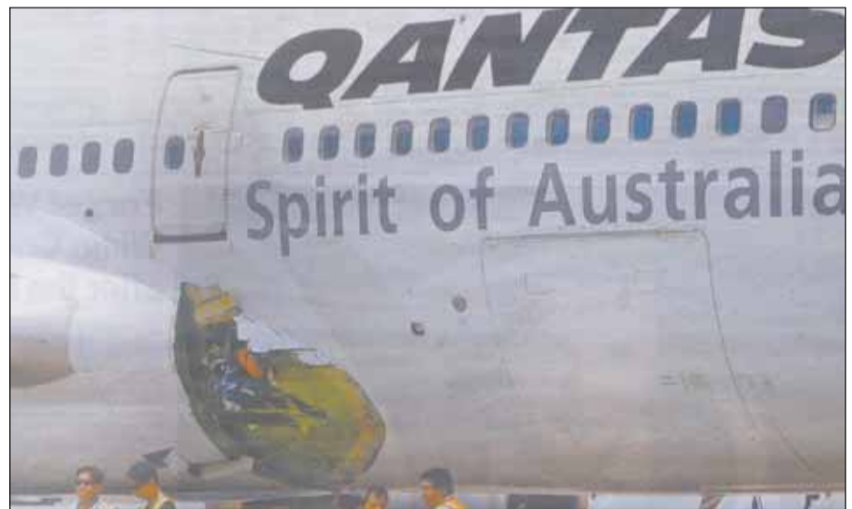
Η αρχή τού κακού ήταν έκρηξη σε αεροπλάνο της Qantas και ακολούθησαν άλλα έξι περιστατικά με προβλήματα σε αεροσκάφη τού εθνικού αερομεταφορέα της Αυστραλίας.