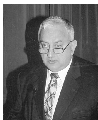
Ο βουλευτής της περιφέρειας Μπάνκσταουν κ. Ντάριλ Μέχλαμ