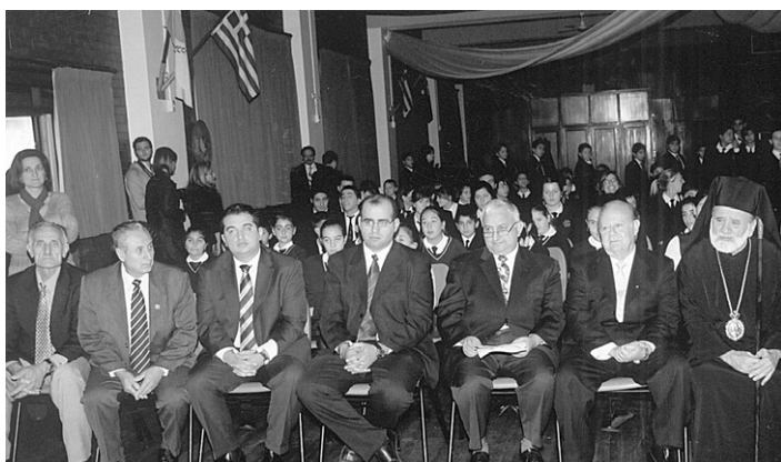
Αποψη του κοινού